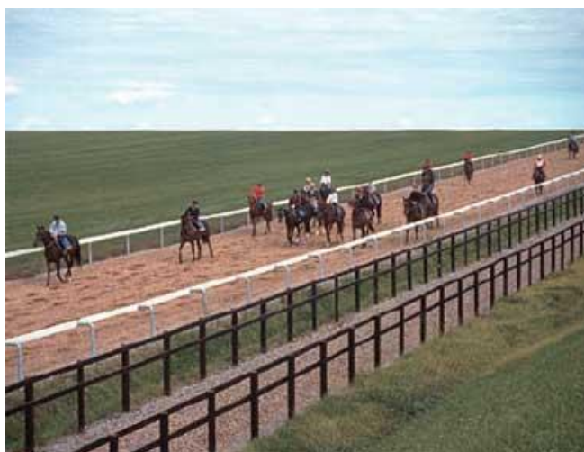
Ferme d'entraînement des yearlings de Hokkaido