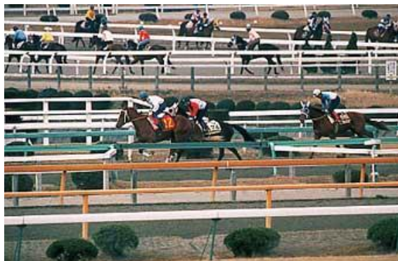
Travail sur piste du matin au Centre d'entraînement de Ritto

Tous les chevaux enregistrés auprès de la JRA doivent être logés et entraînés dans l'un des deux centres d'entraînement de Miho et de Ritto. Les chevaux engagés dans une course sont transportés à l'hippodrome par un véhicule pour chevaux et retournent au centre d'entraînement après la course. Chaque hippodrome dispose d'écuries permettant temporairement d'héberger les chevaux visiteurs.