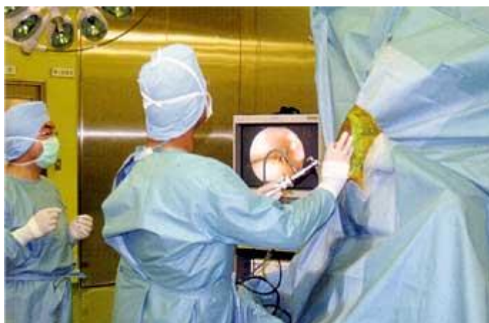
Elimination de morceaux d'os par chirurgie arthroscopique

Les centres d'entraînement de Miho et de Ritto disposent d'hôpitaux ultra-modernes exploités chacun par une trentaine de vétérinaires basés en permanence sur place. Les installations et le savoir-faire de ces hôpitaux permettent de réaliser en particulier les activités suivantes : (1) Diagnostic et traitement des maladies et des troubles locomoteurs survenant au cours