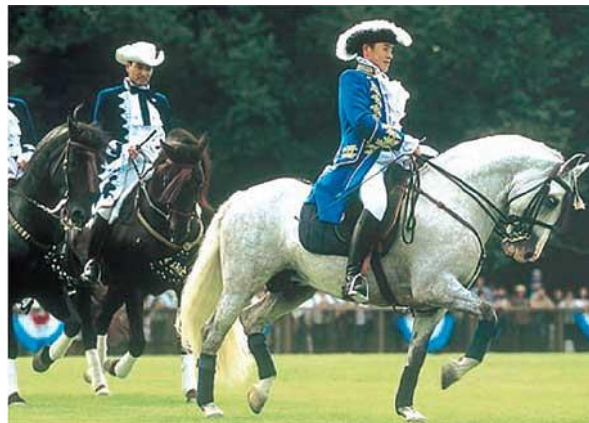
Une scène de spectacle des chevaux andalous au Parc équestre

Le Parc équestre de la JRA a été construit en 1940 dans l'arrondissement de Setagaya à Tokyo, en vue notamment de diffuser et promouvoir le hippisme auprès du grand public, ainsi que de former de futurs jockeys. Vingt-quatre ans après son inauguration, lors des Jeux Olympiques de Tokyo en 1964, ce parc eut le privilège d'accueillir une partie des épreuves d'équitation. Utilisé pendant un certain temps comme centre de formation et d'entraînement des