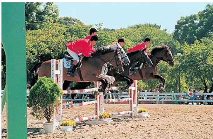
Concours hippique au Parc équestre

équestres au Japon. Les installations comprennent un manège couvert qui permet tant d'organiser de grandes manifestations tout au long de l'année. Y ont été accueillis, en novembre 1991, un spectacle donné par les cavaliers de l'École d'équitation espagnole de Vienne, et en novembre 1998, celui présenté par le Cadre Noir de Saumur (École nationale d'équitation). Le parc, ouvert au public tout au long de l'année et fréquenté par de nombreux habitants de la ville, se veut bénéfique pour la collectivité locale en tant que « Parc des chevaux » de la métropole. Il abrite sur 180 000 m 2 de terrain, diverses installations : parc, écuries, pistes équestres et immeubles administratifs.