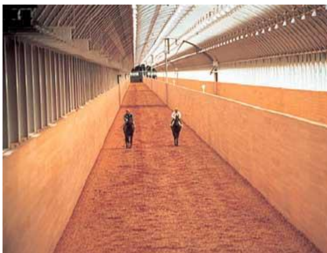
Piste couverte en ligne droite de la Ferme d'entraînement des yearlings de Hidaka

course. Le système intégré de recherches de la JRA, qui porte sur un vaste ensemble de chevaux de course, est inégalé dans le monde.