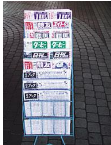
‘경마신문’은 경마장이나 경마장 부근에서

상의(봄/가을); 특히 봄과 가을에는 일몰 후에 날씨가 쌀쌀해집니다. 이런 날에는 가벼운 상의를 준비하시는게 좋습니다.