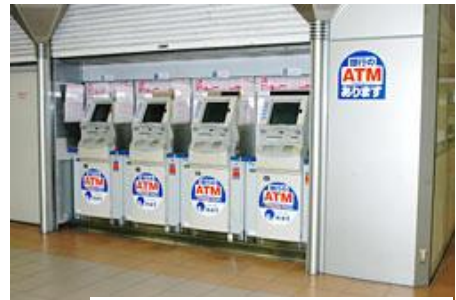
경마장 내에 ATM 기계가 설치돼