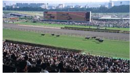
JRA 경마장에 복장규정은 별도로 없습니다.

경마장을 찾는데 정식 복장규정은 별도로 없습니다. 티셔츠나 청바지, 셔츠와 반바지 등 어떤 복장을 해도 무방합니다. 그러나 지정석에서 관전할 경우는 ‘스마트 캐주얼’이 바람직할 것입니다.