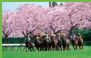
櫻花 從正面到第4轉角有櫻花林蔭，為賽事增添了不少色彩。每年皐月賞正是在櫻花盛開時節舉行。