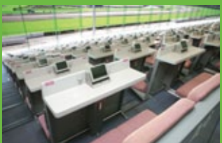
指定席 設有可以舒適觀賽的宮都拉席等5種指定席，以及敬老席、輪椅席。