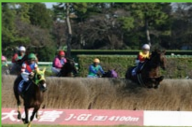
障礙賽 是日本難度最大的障礙賽道。中山大障礙、中山跳欄兩大GI錦標賽都在此舉辦。

能近距離感受馬匹呼吸與騎師表情的新景點 「Grand Prix Road (最高獎之路)」登場！終點前的知名陡坡攻防、 上下起伏很大的坡路障礙等， 讓您享受震撼力十足的賽馬之樂。